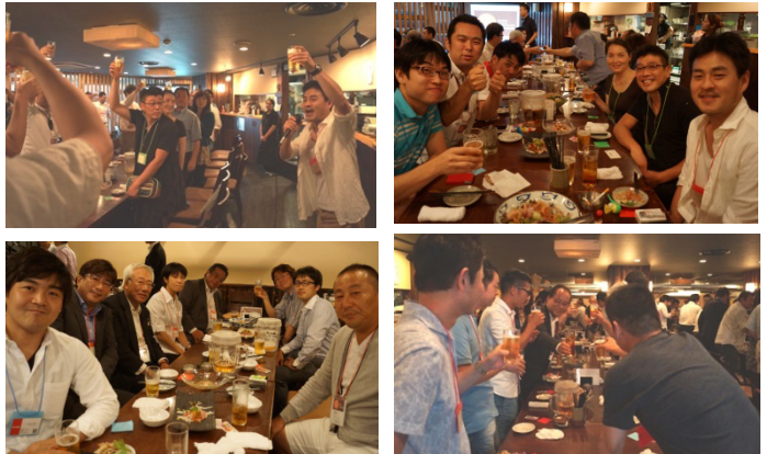
↓ 昨年の開催の様子